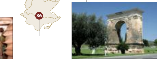
Arc de Barà (Roda de Barà)