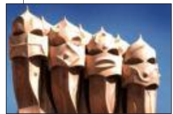
Chimeneas de La Pedrera, de Gaudí (Barcelona)