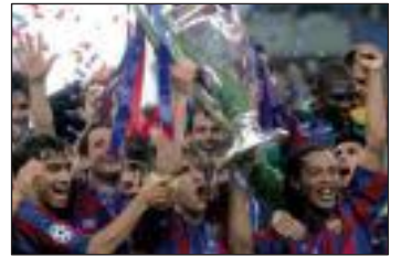
El Barça celebra la Copa de Europa (31)