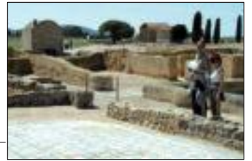
Ruinas grecorromanas (Empúries)