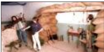
Museo de la batalla del Ebro (Gandesa)