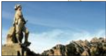
El timbal del Bruc